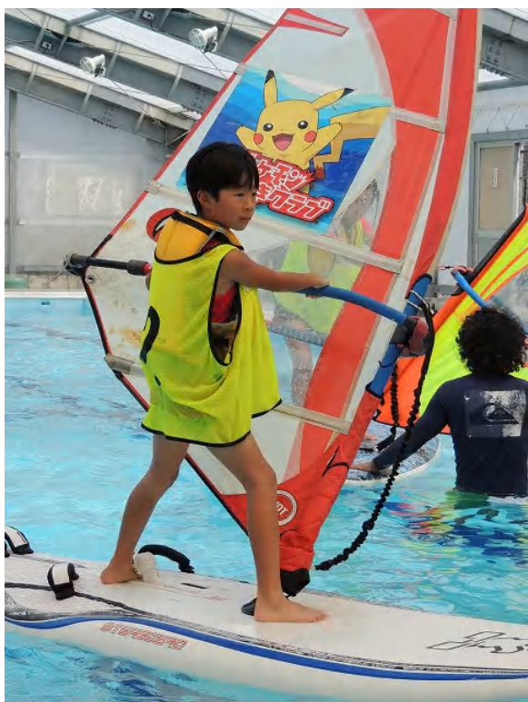
子供たちも真剣に頑張っています。一人で方向転換できるまでになりました。