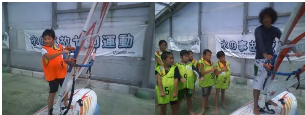
貴島講師による陸トレも好評です