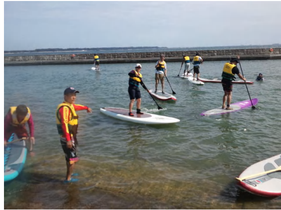
SUPの体験会も行われました。初めての方も多かったです。