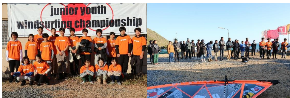
ウインドサーフィンの競技の中で、最も過酷なウェイブ競技に参加する選手達

時間と共に徐々に上がり始めた風の中で中学生・高校生クラスも滞りなくヒートは消化。お昼の休憩をはさみ、午後の部は毎年レベルが高く、最も激戦となるU-21クラスがスタート。このクラスには少し物足りないコンディションであったが、その中でも選手のハイレベルなパフォーマンスはギャラリーを魅了した。