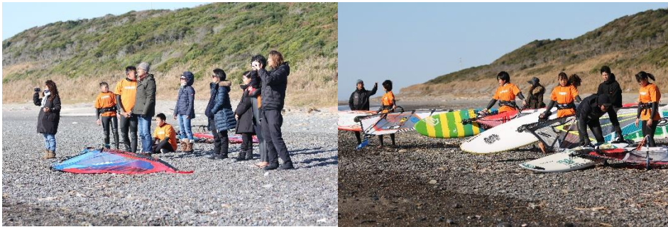
間近で子供たちの頑張る姿を観戦する父兄や仲間たち