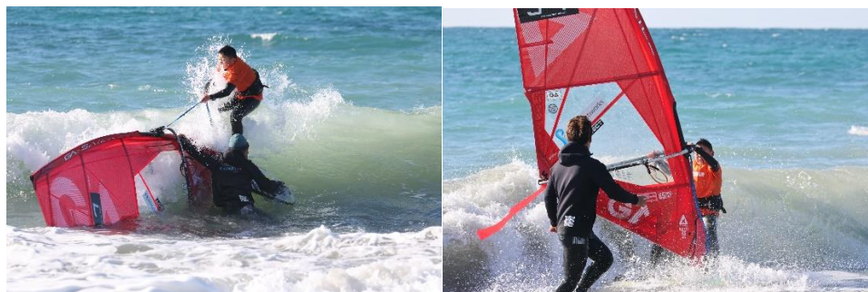
クラブのインストラクターやトッププロ選手によるサポート