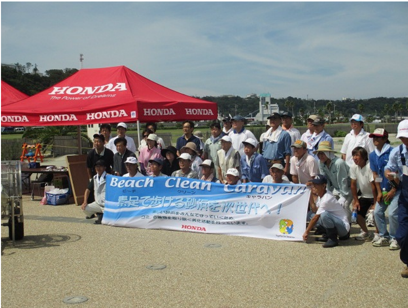
素足で歩ける砂浜を次世代へ！ とても良いキャッチフレーズです

スマイルプロジェクトからの参加はOWCメンバー、地元SUPERを含め30名ほどがお手伝い。